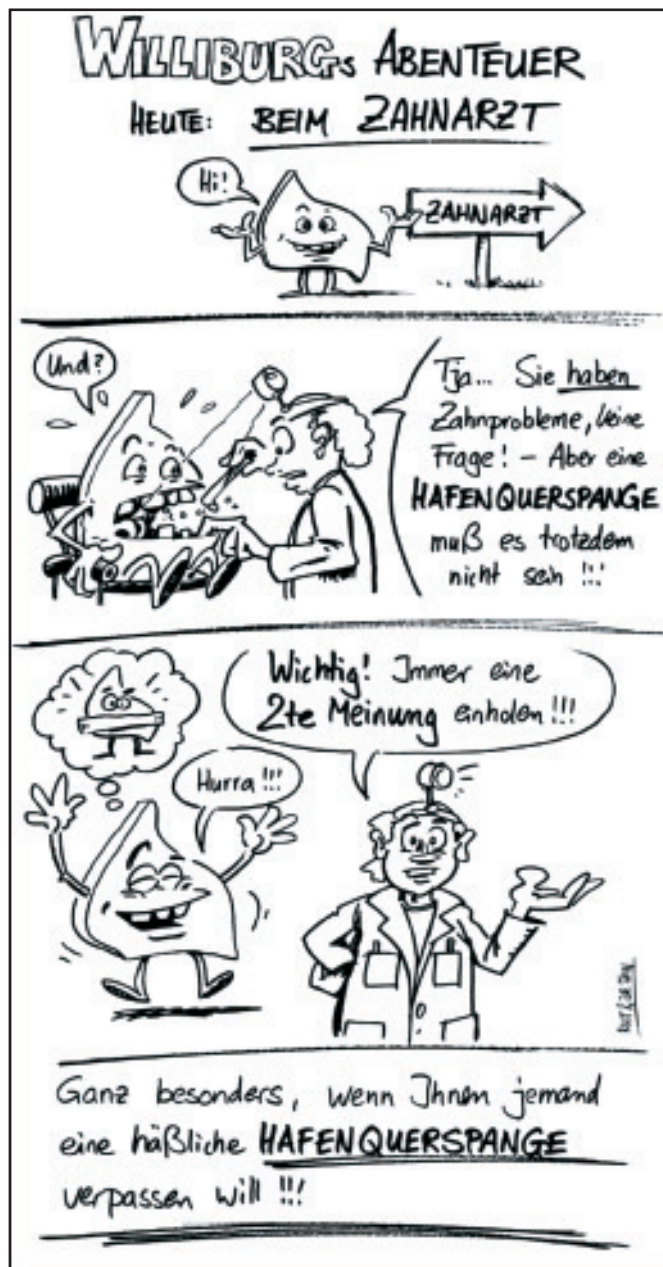
Karikatur Rost und Dr. Stein

Der Verein ist überzeugt: Zur geplanten sog. "Hafenquerspange" gibt es kurzfristig wirksame, innovative und kostengünstige Alternativen. Mit Witz und Argumenten werden wir nicht müde nachzuweisen, dass es im 21. Jahrhundert bessere Lösungen gibt als neue Autobahnen im Herzen der Stadt.